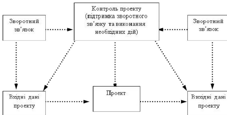
Рис. 2. Система управління моніторингом проекту